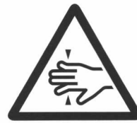
指を挟まれないよう注意

⊙記号は禁止の行為であることを告げるものです。図の中に具体的な表示内容（上図の場合は分解禁止）が描かれています。