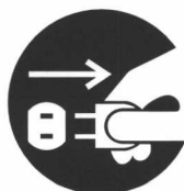
電源プラグをコンセントから抜け

●記号は行為を強制したり表示する内容を告げるものです。図の中に具体的な表示内容（上図の場合は電源プラグをコンセントから抜け）が描かれています。